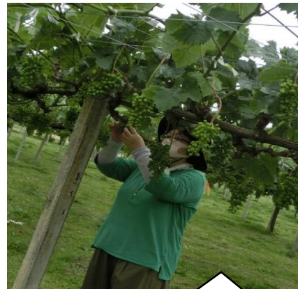
ぶどうの摘粒作業です。

初めてのシャインマスカットの摘粒作業は、私にとって新鮮な気持ちで出来ました。シャインマスカットを食べるまでに色々な作業があり大変ななだと思いました。もし食べる事があつたら、ゆっくり味わって食べたいと思いました。貴重な体験でした。ペンネームくまのびーさん