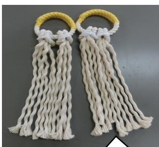
完成したわらのわです。

今年も、福島わらじ祭り用の「わらのわ」を手掛ける事が出来ました。持ち手にテープをまく、ひもを結ぶ、ひもの先のテープを取りひもをほどく。どの工程もメンバーの皆さんが丁寧に仕上げてくださいました。